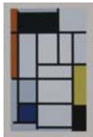
E-156 ピエト・モンドリアン 赤・黄・青の構成 1957年 紙にシルクスクリーン 61×44cm

美術の教科書にも登場するピエト・モンドリアンの作品とその傾向の作品を通じ、難しいといわれる幾何学抽象構成絵画を身近に感じていただきたいと思います。