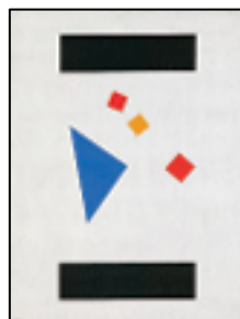
S-043 習作 Study 1972年 キャンバスに油彩 61cm×46cm